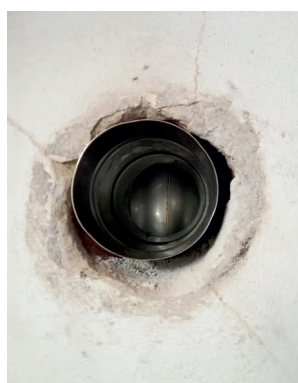
Osazený T-klix s vodorovnou částí