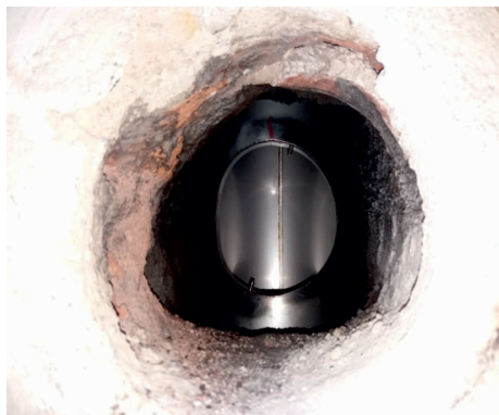
Osazený T-klix bez vodorovné části