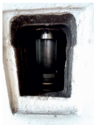
Osazení čistícího prvku