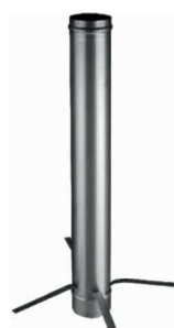
vložka s vystředovací objímkou